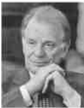
Ж. И. Алфёров

«За годы приватизации и реформы уничтожено более двух третей промышленного потенциала страны. Пора исправлять положение, заставить олигархов вернуть украденное у народа. Национализация позволит сосредоточить в руках государства крупные финансовые ресурсы, направить их на восстановление экономики и решение социальных проблем. И, прежде всего, проблем молодежи. Ей программа молодежной политики Правительства народного доверия гарантирует бесплатное образование, получение работы по специальности, беспрепятственное получение мест в детских садах, перспективу обеспечения жильем».