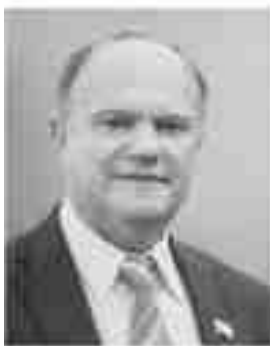
Г. А. Зюганов

Председатель ЦК КПРФ, лидер фракции КПРФ в Госдуме