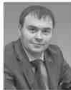
Ю. В. Афонин

«Мы знаем. Вооруженные Силы и военно-промышленный комплекс России придется возрождать заново. И это будет сделано. Чтобы не оплачивать кровью народа его независимость, нужно иметь силы для отпора любому захватчику. И мы готовы проводить такую политику, независимую, миролюбивую, защищающую страну от внешних угроз».