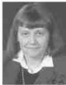
С. Е. Савицкая

Наша цель — вернуть народу величайшее завоевание Советской власти — всеобщее бесплатное образование. Новая индустриализация должна проводиться на основе передовых достижений научно-технического прогресса, и наука вернётся во все отрасли экономики».