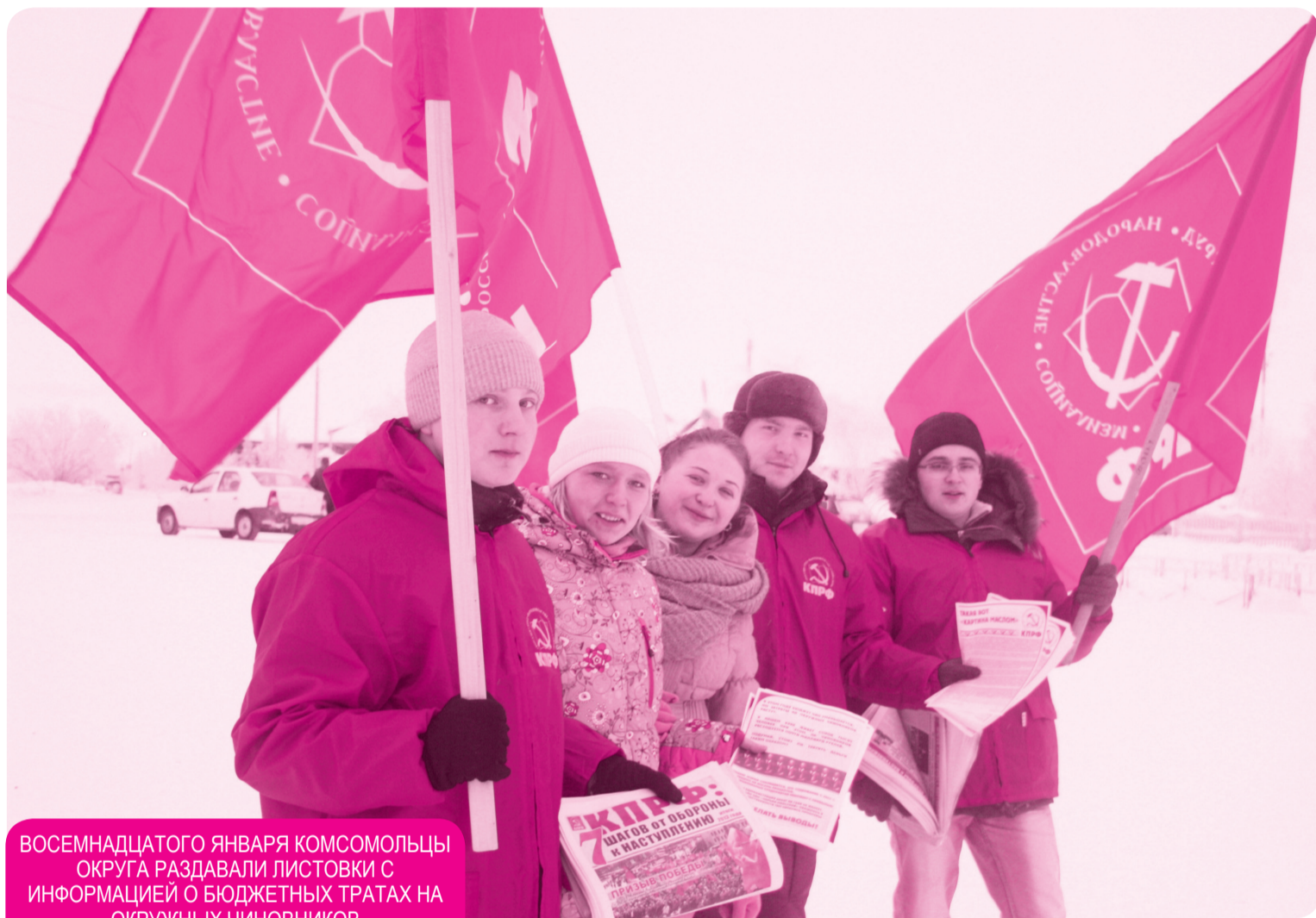
ВОСЕМНАДЦАТОГО ЯНВАРЯ КОМСОМОЛЬЦЫ ОКРУГА РАЗДАВАЛИ ЛИСТОВКИ С ИНФОРМАЦИЕЙ О БЮДЖЕТНЫХ ТРАТАХ НА ОКРУЖНЫХ ЧИНОВНИКОВ