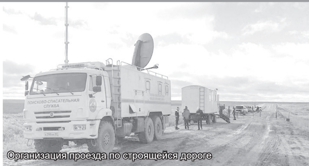
Организация проезда по строящейся дороге

Год прошел, где результат? Были лишь слова, а дальше – тишина. Бездействие чиновников дорого об-