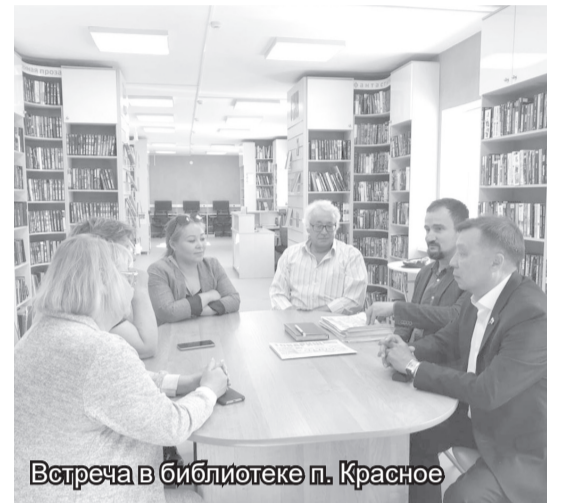
Встреча в библиотеке п. Красное

Но неожиданно, буквально накануне встречи, раздался звонок из сельской администрации: извините, мол, принять не можем. Один в один был ответ и по невозможности проведения встречи в Коткинском физкультурно-оздоровительном комплексе. Сразу было понятно, откуда «ветер дует» — из окружной Администрации, не нравится чиновникам, когда депутаты от оппозиции обсуждают проблемы сельчан.