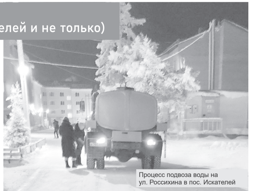
Процесс подвоза воды на ул. Россихина в пос. Искателей

В общем, спустя два месяца с обещанных перед выборами дат перерезания ленточки, воз и ныне там. Водозабор выглядит по старому, за исключением красивых стендов на входе. Перед прошедшими выборами Президента России к жителям поселка Искателей без