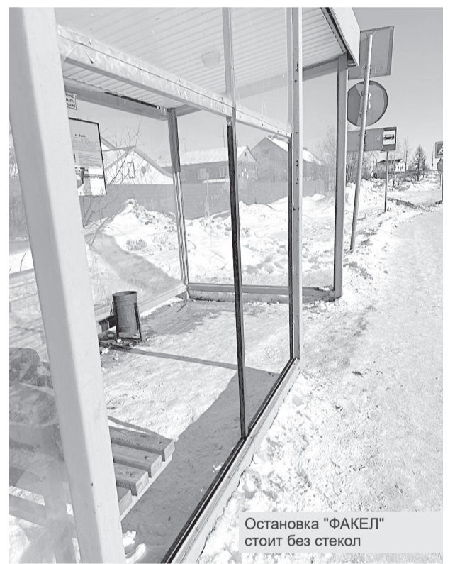
Остановка "ФАКЕЛ" стоит без стекол