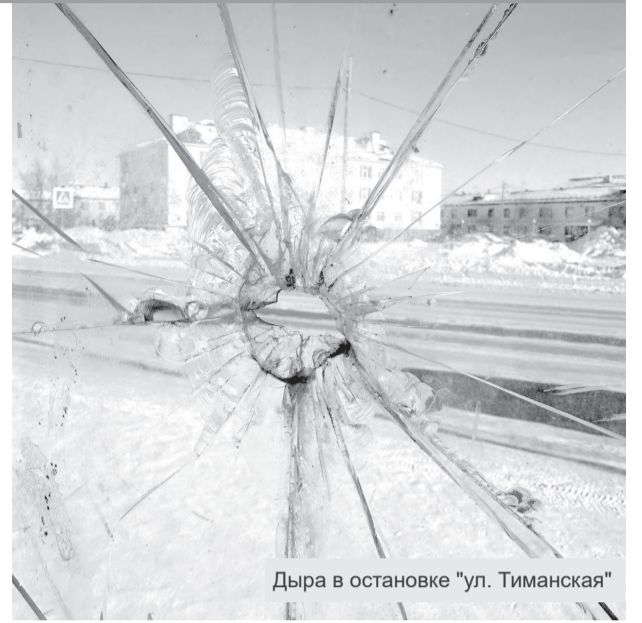
Дыра в остановке "ул. Тиманская"

Пассажиры просят руководство предприятия, курирующий его Департамент строительства ЖКХ, энергетики и транспорта НАО, наконец обратить внимание на плачевное состояние остановок (и всегда обращаться) и привести их в надлежащее состояние.