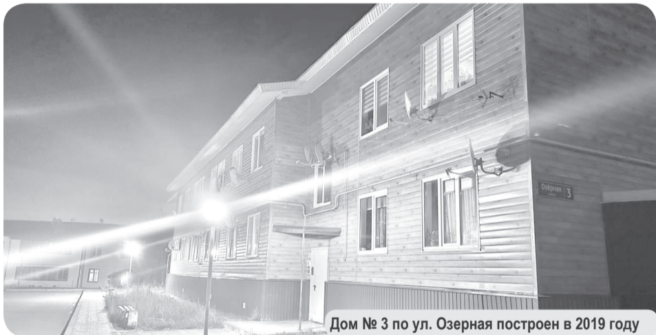
Дом № 3 по ул. Озерная построен в 2019 году

Эти квартиры приобретало подведомственное учреждение Департамента строительства, ЖКХ, энергетики и транспорта НАО по контракту у застройщика ООО «Версо-М», который проходит процедуру банкротства. Граждане не первый год требуют от властей поселкового и окружного уровня принять меры по решению их проблемы, но, пока безуспешно.