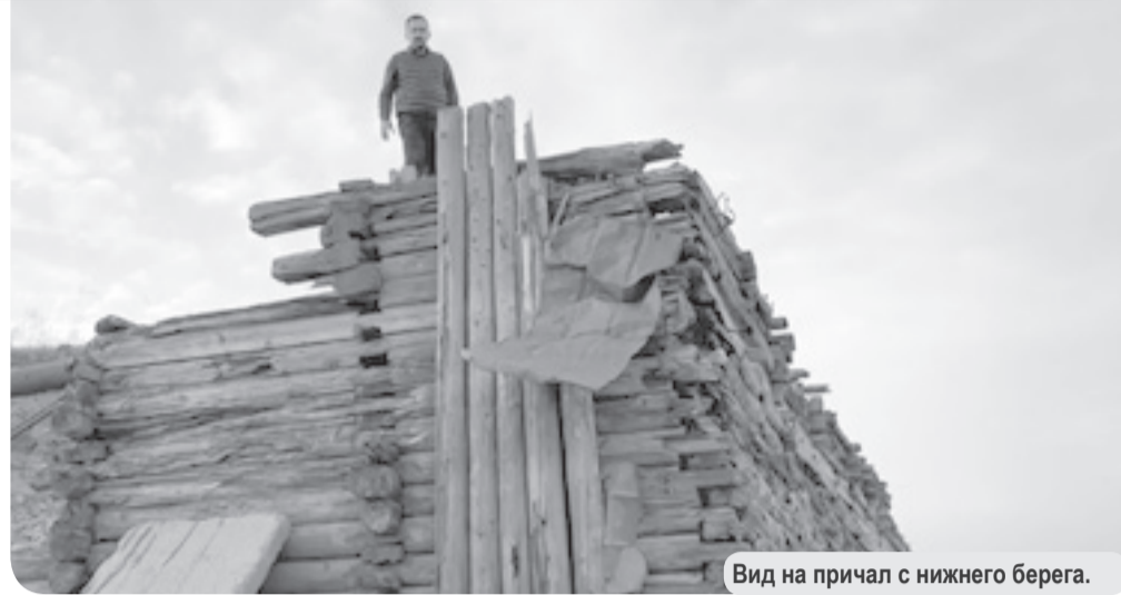
Вид на причал с нижнего берега.

ные, игры без контроля взрослых в подобных местах могут закончиться плачевно. Поэтому, народные избранники фракции КПрФ Собрании депутатов НАО подготовили и на-