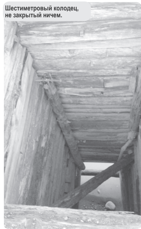
Шестиметровый колодец, не закрытый ничем.

Прямо к опасному сооружению свободно подъезжают автомобили горожан, гуляют взрослые и дети. Рискованно находится не только у кромки воды или льда под причальной стенкой, но и сверху сооружения, где зияют квадратные провалы деревянных колодцев по 6 метров глубиной. Судя по состоянию причала, владельцам морского порта, который в свое время приобрела через АО «Ненецкая нефтяная компания» по распоряжению Администрации НАО, до него давно уже нет дела, и объект имеет все