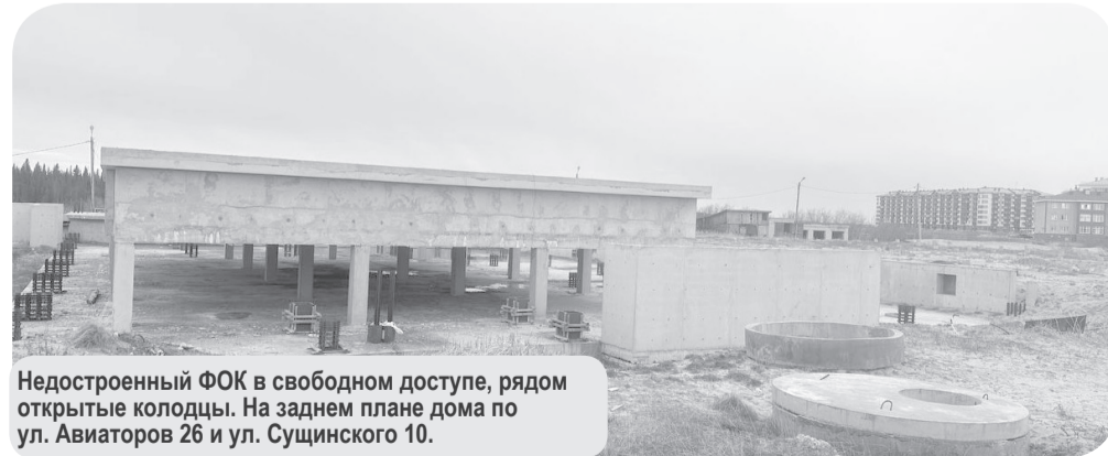
Недостроенный ФОК в свободном доступе, рядом открытые колодцы. На заднем плане дома по ул. Авиаторов 26 и ул. Сушинского 10.