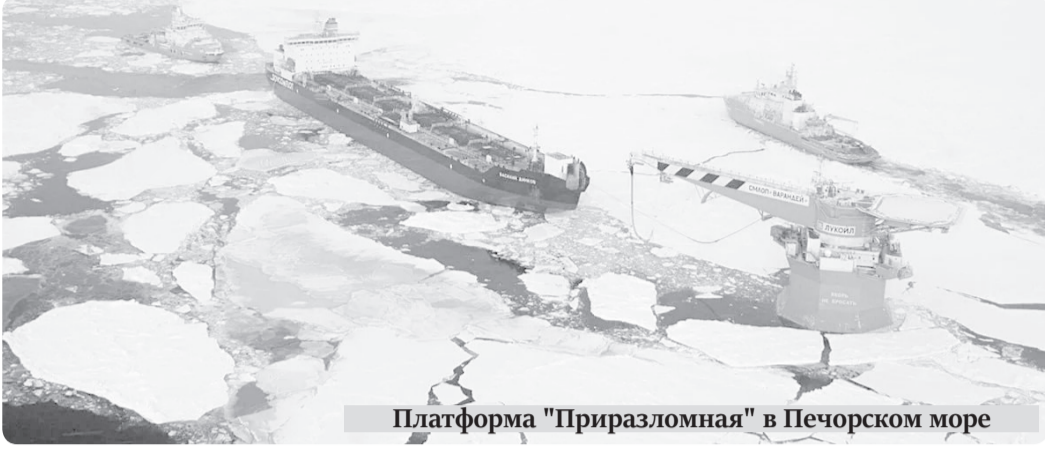
Платформа "Приразломная" в Печорском море

Жителя округа не удивишь сообщениями об очередных санкциях коллективного Запада. Новости эти как-то приелись и адресного отношения к жизни Ненецкого автономного округа не имели. По крайней мере, до 14 января 2024 года.