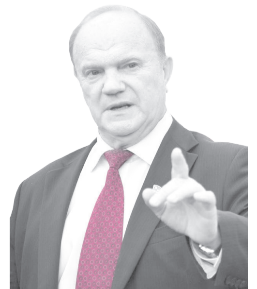
Референдум уже стартовал!

Ненецкое ОК КПРФ приняло решение вынести пятым пунктом на голосование в НАО следующий вопрос: поддерживаете ли Вы инициативу коммунистов НАО, исключаящую возможность объединения регионов, входящих в Арктическую зону России?