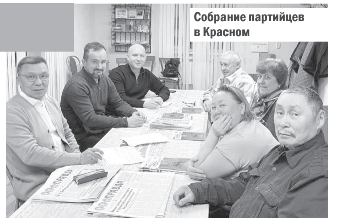
Собрание партийцев в Красном

Позиция наших однопартийцев из Красного будет учтена фракциями КПРФ в окружном Собрании и Совете Заполярного района при обсуждении вопроса о реализации муниципальной реформы.